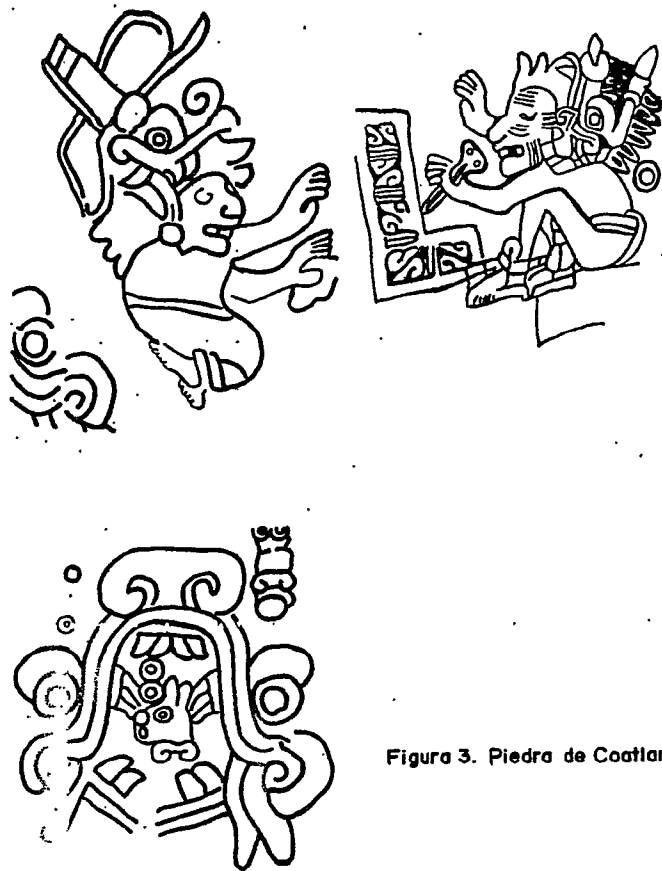
Figura 3. Piedra de Coatlan, Morelos.