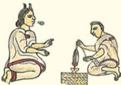
Imágenes: Códice Mendocino, folio 58R

De acuerdo con Weitlaner, los mexicas tenían por patrona de las labores textiles a Xochiquétzal. Según la autora: "Xochiquétzal [fue] la primera mujer, según se decía, que había hilado y tejido. En el Códice Matritense, se representa a Xochiquétzal sentada frente a un telar, vestida ricamente y adorada por mujeres que tenían gran habilidad con la aguja [...]. Tlazolteótl-Toci, quien principalmente era la diosa del henequén y del algodón, también estaba íntimamente asociada con el hilado y el tejido; aparecía con madejas de algodón sin hilar y con husos en su tocado" (2005: 4).