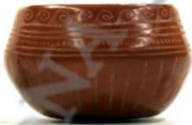
Cajete de forma compuesta. Texcoco Blanco sobre Rojo

Los diseños incluyen cuatro Ehecacózcatl o Caracoles cortados, elemento representativo de Ehéctal.